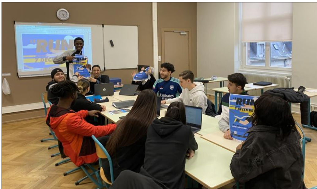
Les lycéens du Roosevelt organisent un premier Run le mercredi 7 décembre, au départ du stade de l'III, à Mulhouse. La manifestation est gratuite et ouverte à tous.

La classe s'est répartie les rôles, entre ceux qui ont tracé le parcours, ceux qui se sont chargés de