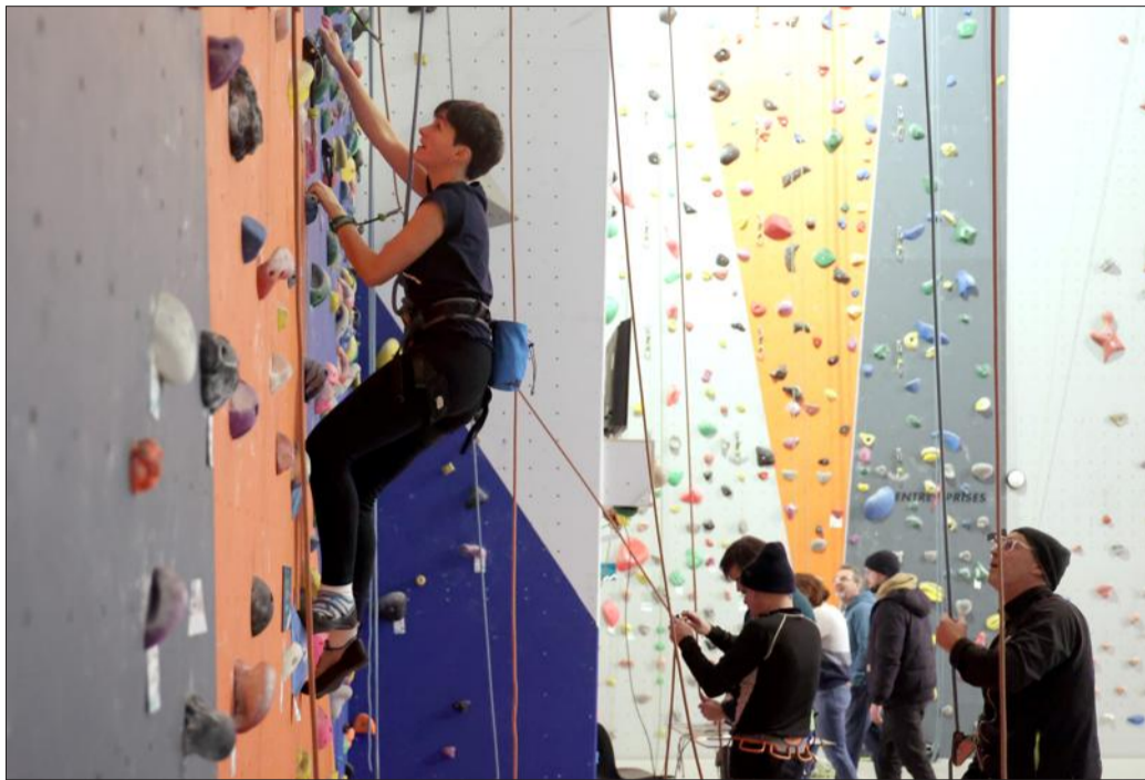
Objectif affiché pour cette première participation au Téléthon : grimper au moins 8 849 m, la hauteur officielle de l'Everest.

Côté dons, ce samedi, vers 15 h, la barre des 900 € était franchie - l'objectif à atteindre était de 500 € - et côté sportif, le sommet de l'Everest, de 8 849 m, a été atteint, et même largement dépassé à 15 h 20 précises. Un objectif en chassant un autre, les participants ont donc visé la