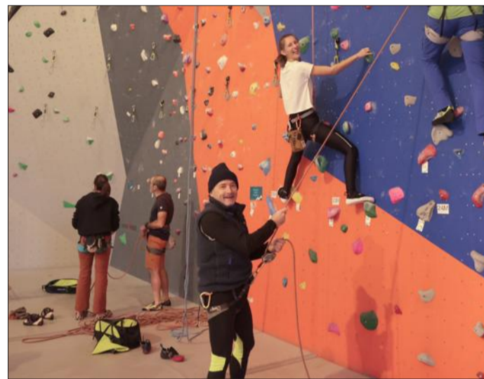
L'équipe du site a encadré les participants débutants. Avec le sourire.

lune... On l'aura compris, le Climbing Mulhouse Center (ou CMC) a voulu faire de ce rendez-vous populaire et solidaire une grande fête et les amateurs du genre sont venus de tout le bassin mulhousien, de Thann et même de Belfort pour s'attaquer à ces murs de 25 m de verticalité sur le plus haut mur d'escalade intérieur de France.