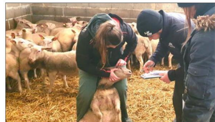
Les candidats ont été soumis à une série d'épreuves théoriques et pratiques inspirées des gestes quotidiens de l'éleveur.

La filière ovine souhaite susciter des vocations car, dans les prochaines années, plus d'un éleveur de brebis sur deux partira à la retraite.