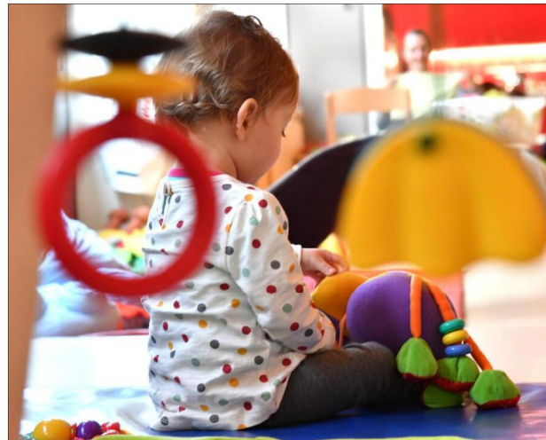
La crèche pourra accueillir une dizaine d'enfants.

« Le Filal travaille un peu comme ABCM : une association ne peut pas couvrir tout le territoire, mais elle peut monter l'exemple », ré-