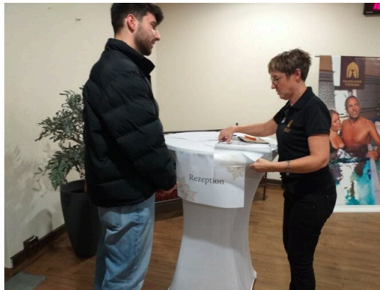
L'établissement du bien-être proche de Sarreguemines vit de sa proximité frontalière avec la France.