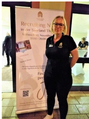
« Comme les thermes reflètent cette atmosphère de détente, plusieurs candidats ont dû penser que les métiers de la gastronomie et de la réception n'étaient pas stressants », pense Mélanie Nickles.