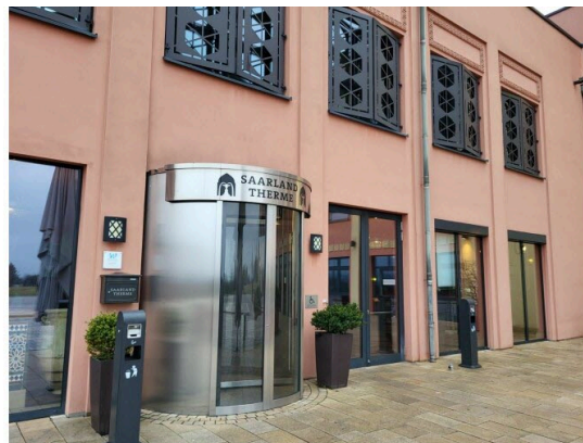
L'établissement de bien-être aura besoin à nouveau de Français pour son projet d'extension prévu en 2024.