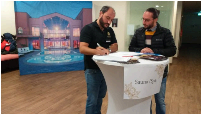
Aujourd'hui, 60 % du personnel de Saarland Therme est français. Cet établissement de détente compte renforcer davantage ses équipes franco-allemandes.