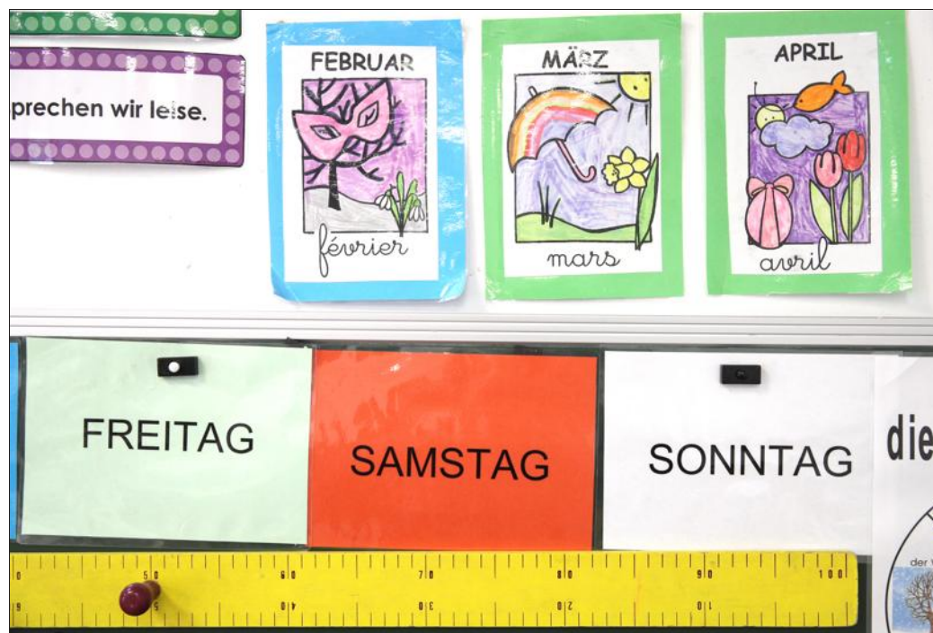
Les enseignants bilingues peuvent trouver sur la plateforme Plarela plus de 2000 ressources pédagogiques.

Plus de 2000 ressources sont déjà mises en ligne sous formes de manuels, de livres de contes, de jeux, d'applications, de sites, de kamishibai, vademecum... Au fil