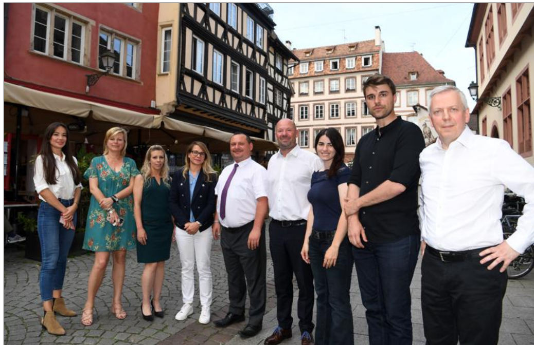
Les candidats RN aux législatives dans le Bas-Rhin. De gauche à droite, de la 1 re à la 9 e circonscription.

majorité à l'assemblée et ainsi « les pleins pouvoirs », dit encore Hombeline du Parc. « Donner tous les pouvoirs pendant cinq ans, c'est la certitude d'un rouleau compresseur social et d'une déconstruction méthodique de la France ».