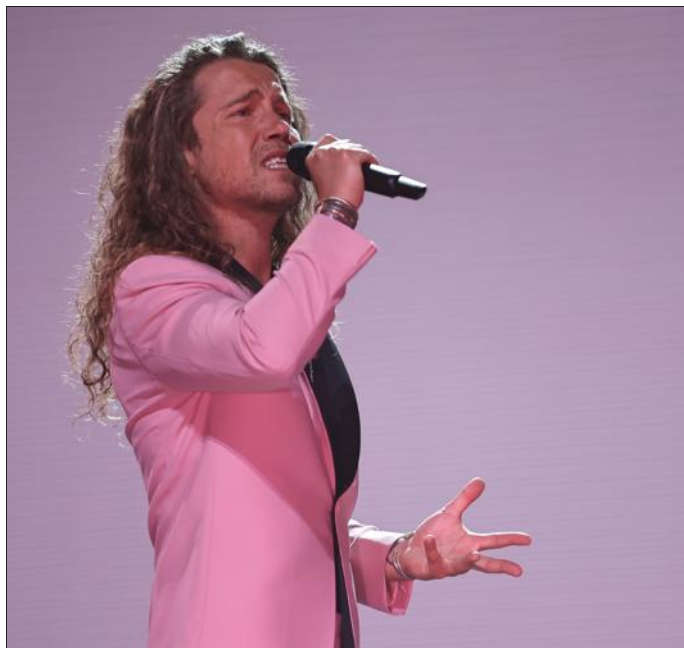
Julien Doré, en rose bonbon ce samedi soir au Zénith de Strasbourg.

Débranchés sensuels en délicieux rose bonbon, ce samedi soir sur la scène du Zénith. Julien Doré y faisait son grand retour à Strasbourg avec son album « Aimée » devant 6 700 fans proches du nirvana.