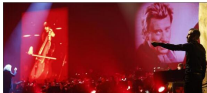
Johnny Symphonique, vendredi dernier.

Retrouvez tous nos comptes rendus de sorties, concerts, spectacles, rencontres sur www.dna.fr en textes et en images.