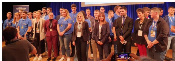
L'équipe régionale des métiers constituée à l'issue de la remise des médailles d'or, à Metz.

À l'issue de la sélection régionale qui a départagé plus de 350 candidats dans la 47 e compétition des métiers (Worldskills), le week-end dernier à Metz, 57 jeunes, pour la plupart âgés de moins de 23 ans, se sont distingués en décrochant la médaille d'or.