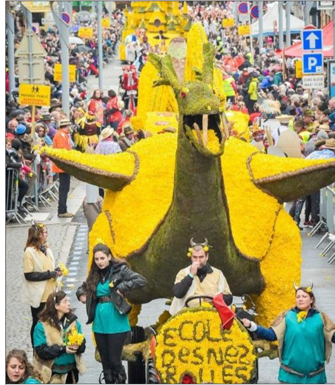
La célèbre Fête des jonquilles ouvrira le bal de la nouvelle saison de la Ronde des fêtes, le week-end prochain à Gérardmer.

Quarante-quatre rendez-vous rythmeront la période du 15 avril au 10 décembre. À côté des incontournables – pour ne