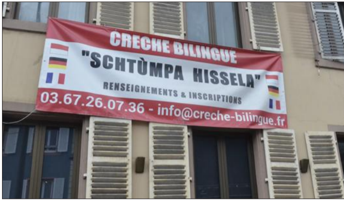
Une microcrèche français, allemand, alsacien a ouvert en 2017 à Moosch.