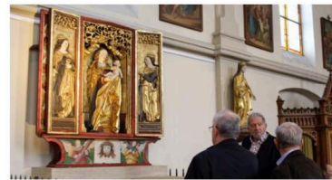
Le retable restauré et réinstallé dans l'église Saint-Christophe de Luemswiller.

Le retable de Luemswiller, datant du XV e siècle, a retrouvé sa splendeur. Cette œuvre sacrée, dont les peintures s'écaillaient et commençaient à tomber, dont le support était attaqué par les insectes, a subi huit mois de restauration à Vesoul, dans des ateliers qui regroupent plusieurs spécialistes agréés par la Drac. Ce samedi, il a été inauguré en présence d'élus, invités, habitants et donateurs, dans l'église Saint-Christophe de ce petit village sundgauvien d'à peine 800 habitants. Aussi rare qu'exceptionnel, ce « trésor de la peinture rhénane de la Renaissance » sera exposé du 4 mai au 23 septembre au Musée Unterlinden, au milieu d'autres œuvres de la même époque.