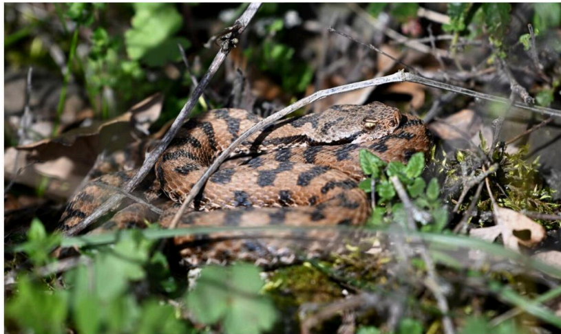
Depuis près d'une cinquantaine d'années, les vipères aspic ont trouvé un biotope à leur convenance dans le Bollenberg, où elles avaient été lâchées par un passionné. Elles profitent des premières douceurs printanières pour sortir de leur hibernation et se chauffer au soleil.