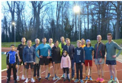
Des athlètes du CSL à l'entraînement sur le Waldstadion de Breisach, désormais éclairé grâce au cofinancement des deux villes sœurs.

La réunion entre les deux conseils municipaux de Breisach et de Neuf-Breisach, le 9 avril dernier, a permis d'officialiser le projet de fusion entre les deux villes sœurs (notre édition du 18 avril). L'une des premières idées avancées dans le cadre de cette initiative européenne, est d'ores et déjà concrétisée. En effet, puisque depuis quelques semaines, les athlètes du CSL de Neuf-Brisach bénéficient de l'éclairage - cofinancé à parts égales par les deux communes - du stade de Breisach (Waldstadion), qui permet ainsi aux sportifs alsaciens de s'entraîner au-delà de la tombée du jour.